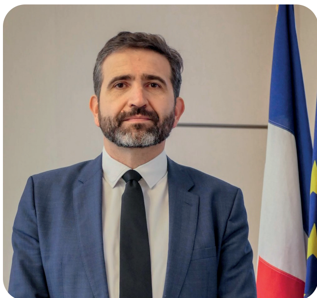
Pascal Courtade Préfet de l'Aube

Puisse cette édition 2026 être, pour toutes celles et ceux qui auront la chance d'y participer, une source d'émotions, d'émerveillement et de découvertes, fidèle à cette pensée de Victor Hugo : « La musique exprime ce qui ne peut être dit et sur quoi il est impossible de rester silencieux. »